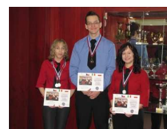
Hotelová škola Hronov