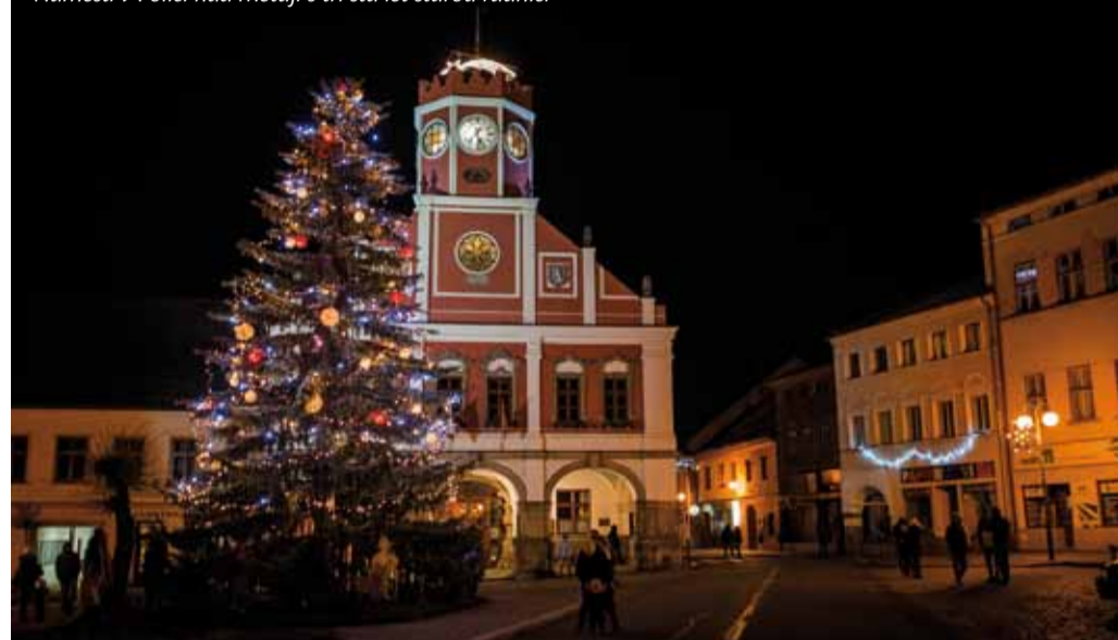
Náměstí v Polici nad Metují s tři sta let starou radnicí

Jiráskovy Lucerny v provedení místního Spolku divadelních ochotníků. Těto události se spisovatel již bohužel nedožil.