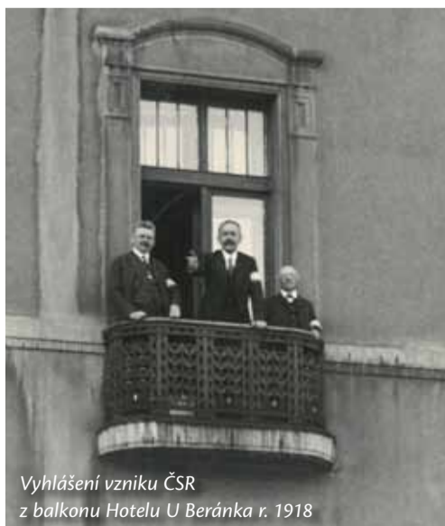
Vyhlášení vzniku ČSR z balkonu Hotelu U Beránka r. 1918

Autor: Bc. Richard Švanda, Lucie Dostálová