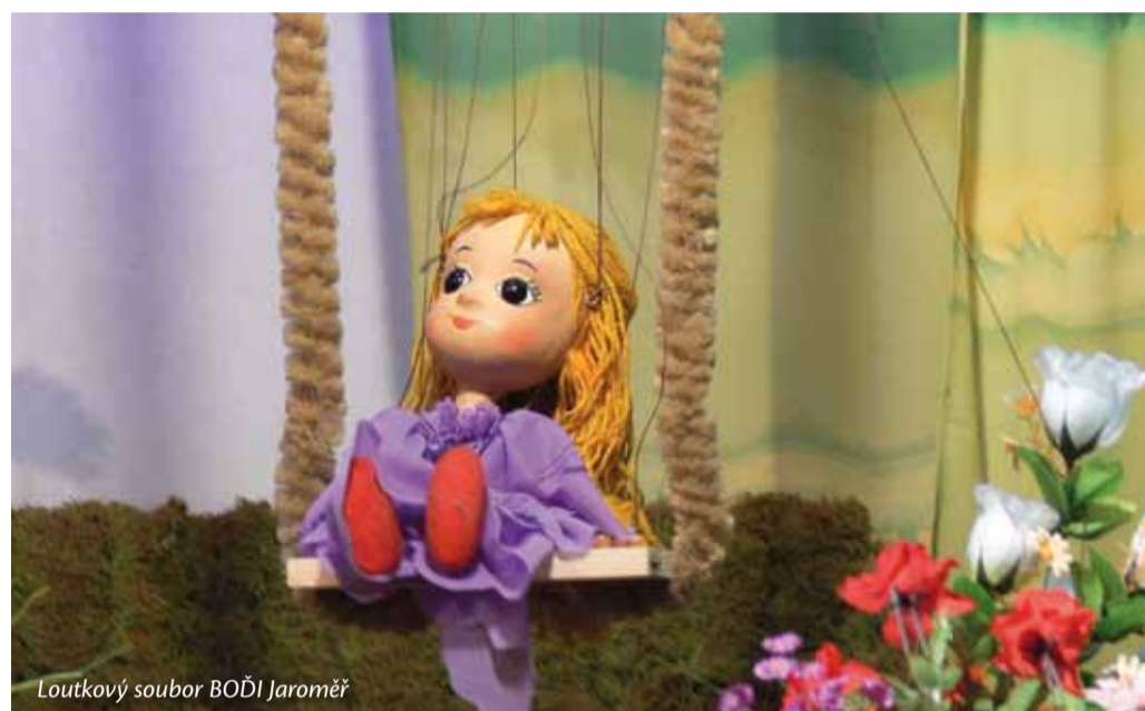
Loutkový soubor BOĎI Jaroměř