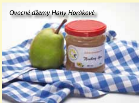
Ovocné džemy Hany Horákové

Pokud jsme Vás již dostatečně nalákali (nejen na