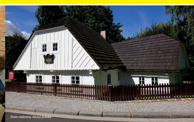
Dom rodzinny Aloisa Jiráska