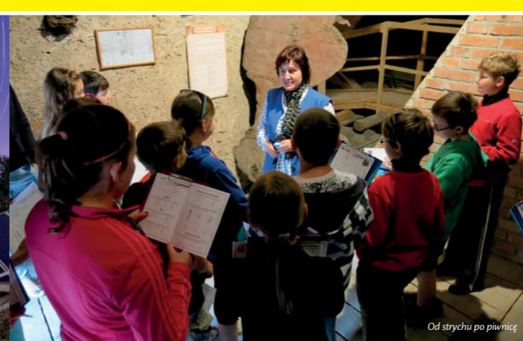
Od strychu po piwnicę